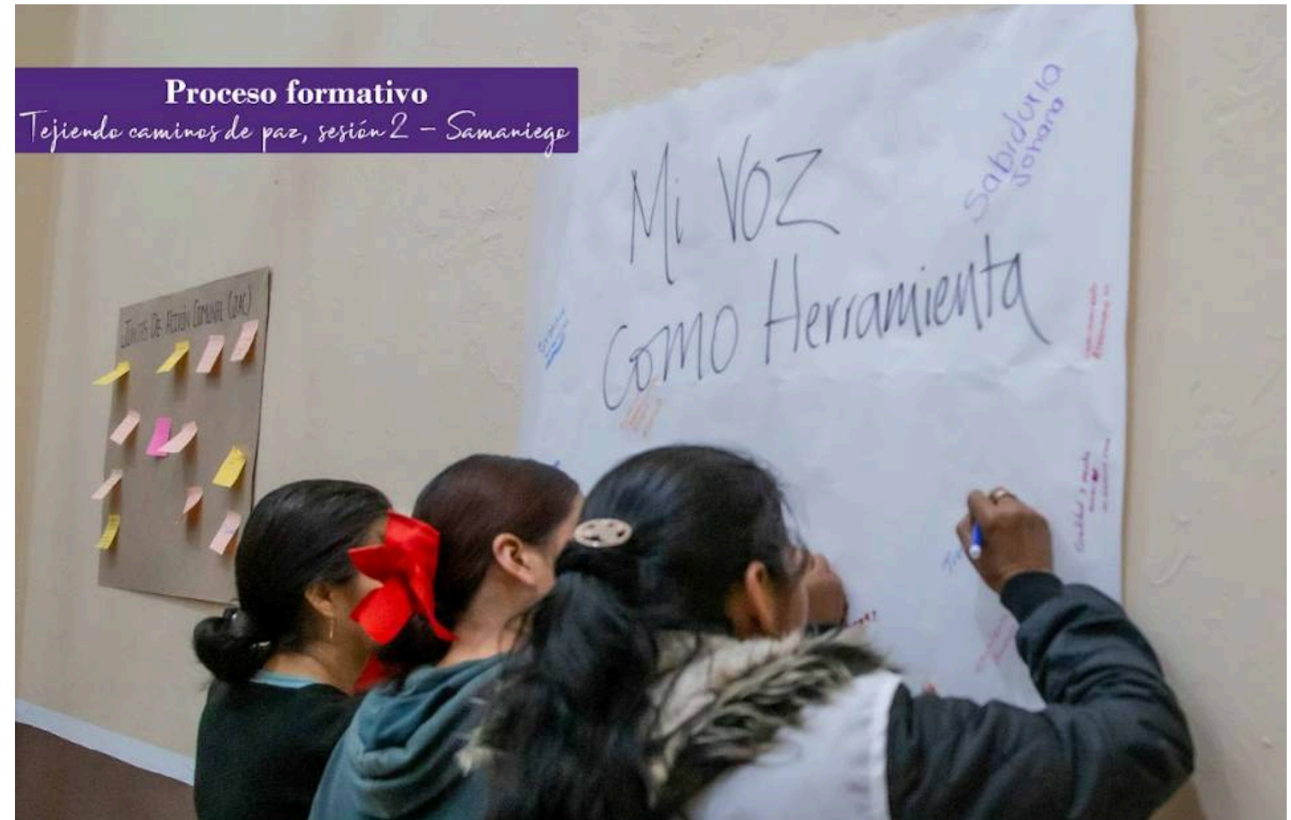
Proceso formativo: Tejiendo caminos de paz