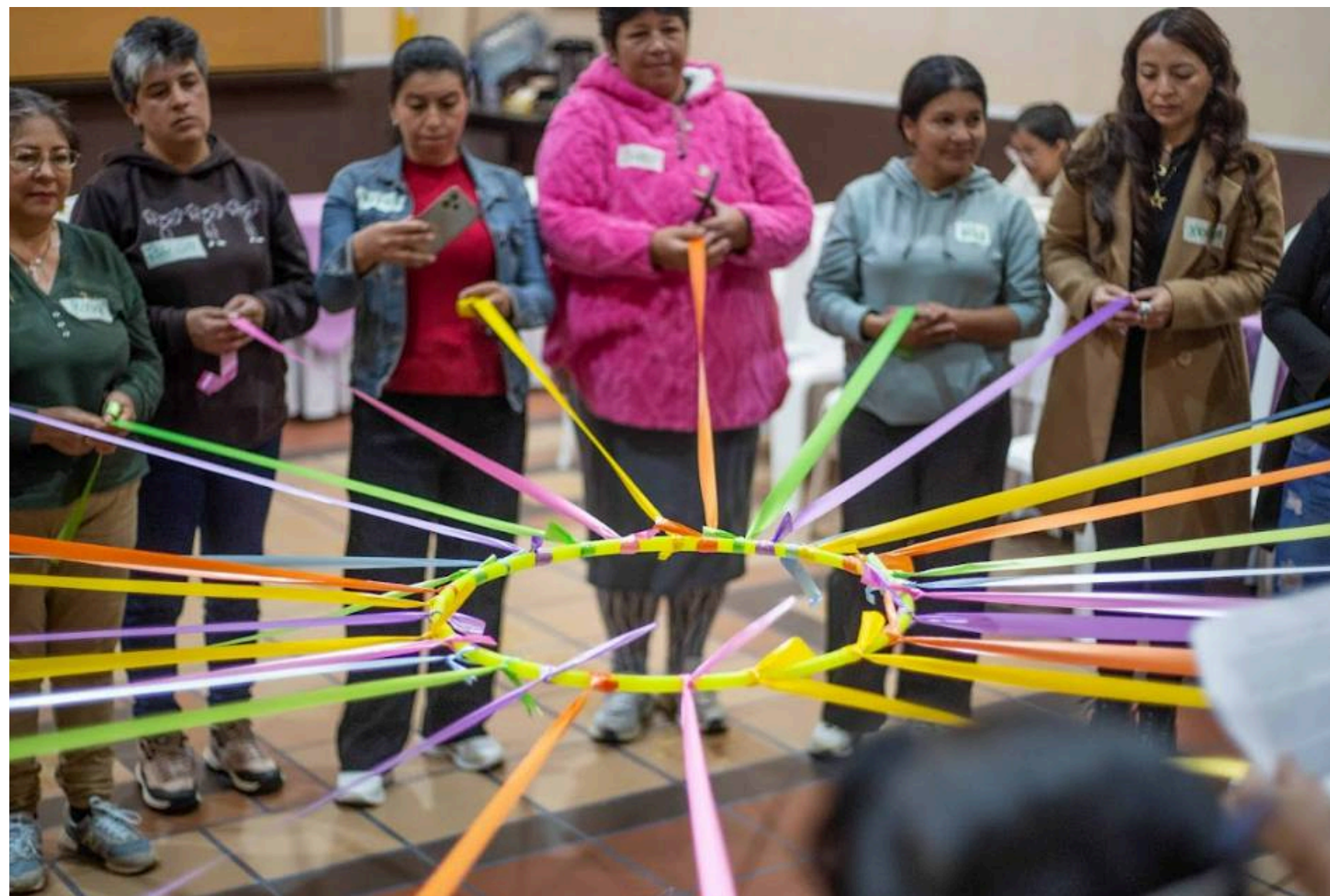
Mesa técnica de trabajo con organizaciones de mujeres víctimas de VS, VBG y VR en el marco del conflicto armado

Foro: Transformar el daño, tejer la vida. Avances y apuestas psicosociales para comprender: ¿Qué hay más allá de la justicia restaurativa para las mujeres víctimas de conflicto armado?