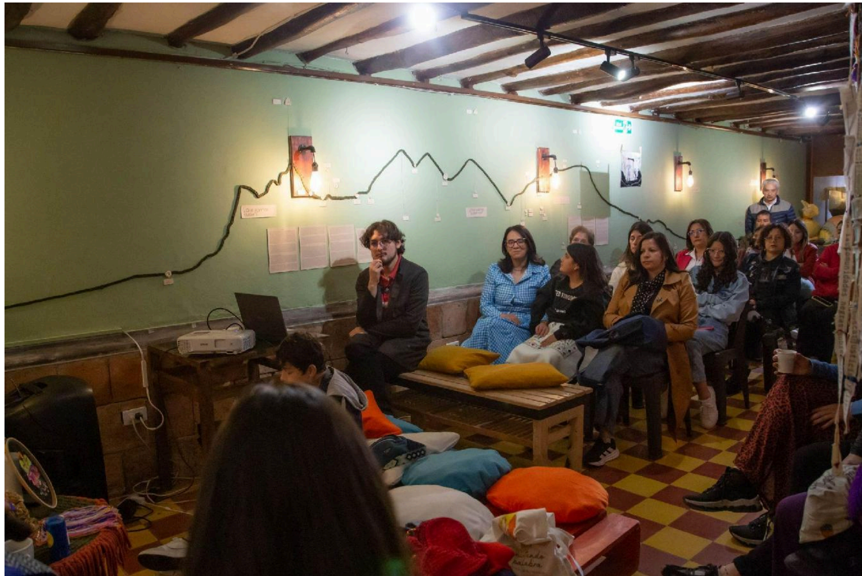
Conversatorio: Mi cuerpo es mi Verdad