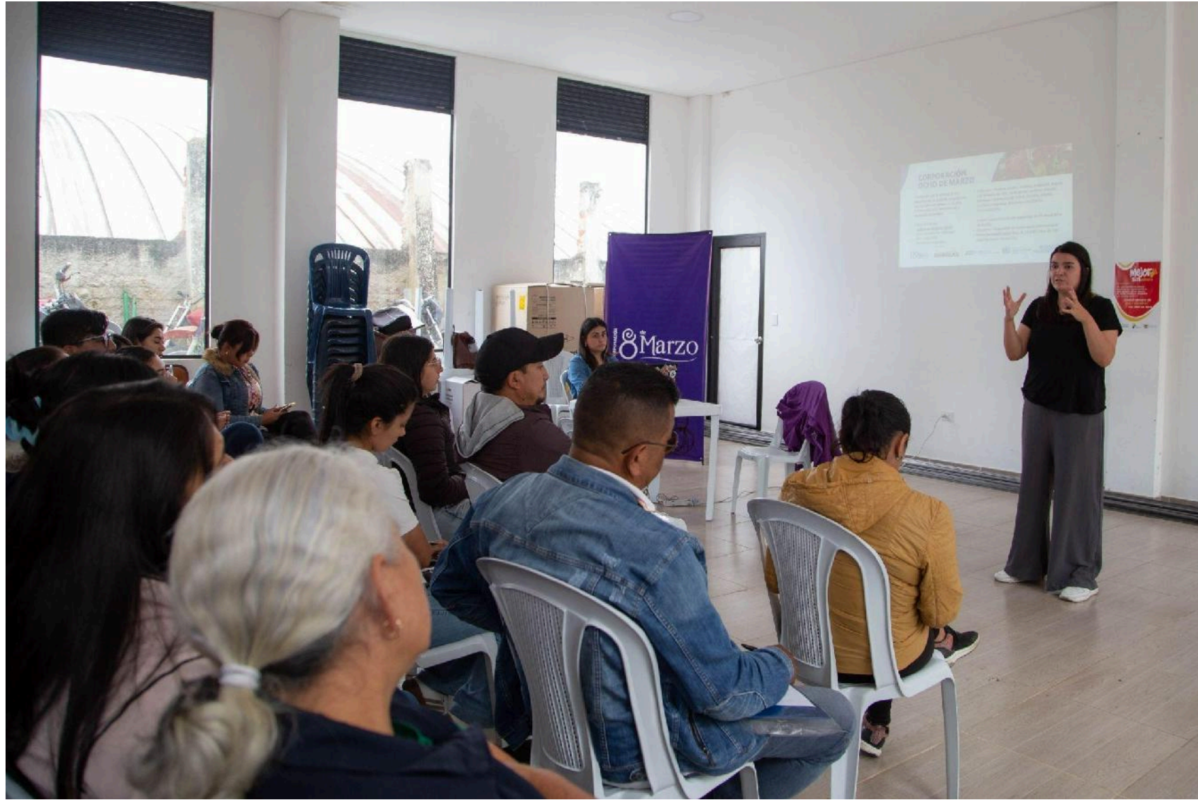
Socialización Proyecto Mujeres tejedoras y constructoras de Paz en el marco de la Justicia Transicional