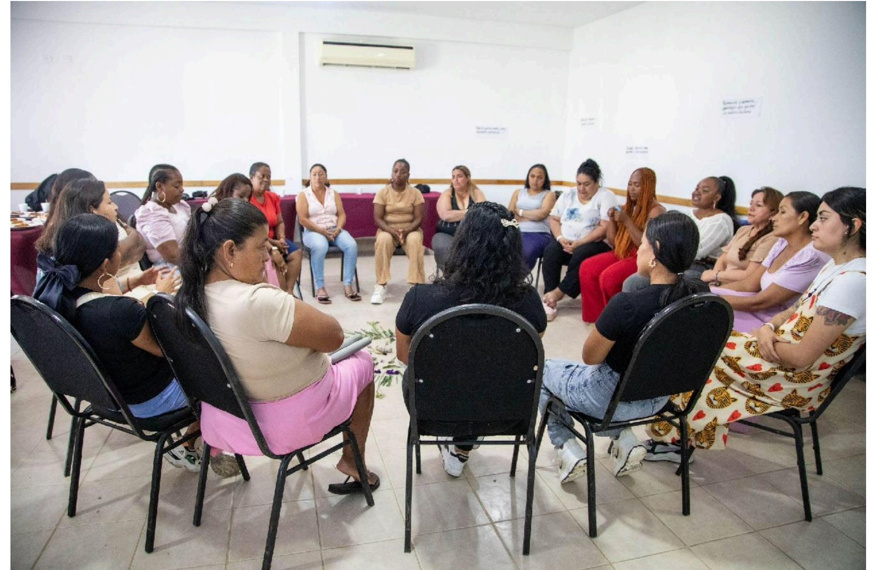
Espacio protector y restaurativo dirigido a mujeres víctimas del conflicto armado. Macrocaso 02